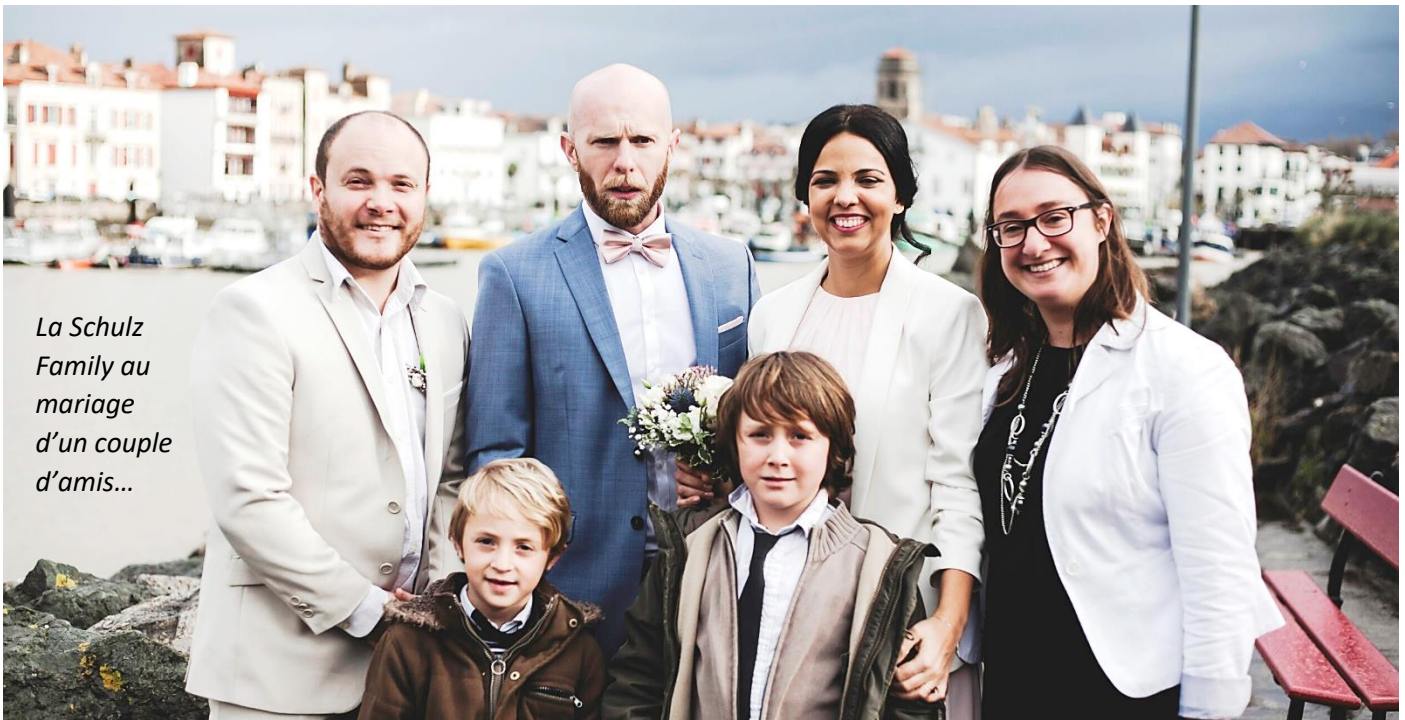
La Schulz Family au mariage d'un couple d'amis...